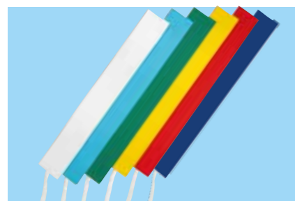
布タスキ (綿地・芯入り)