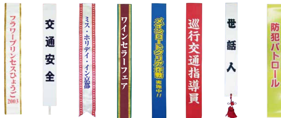
反射タスキ 寸法: 9.5×140cm 生地: 塩化ビニール 価格: 別途見積